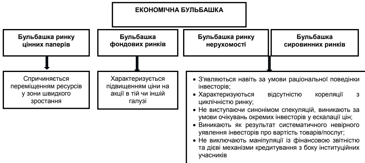
Рис. 1. Класифікація економічних бульбашок